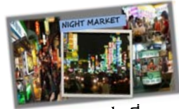
ย่านฝงเจีย

อาหารค่ำ ณ ภัตตาคาร จากนั้นช้อปปิ้ง ตลาดไนท์พลาซ่าย่านฝงเจีย ให้ท่านเลือกซื้อสินค้าราคาถูก เช่น เสื้อผ้าวัยรุ่น กระเป๋า รองเท้า Onitsuka Tiger ตามอริยาตย์ นำท่านเข้าสู่ที่พัก “HOLIDAY INN EXPRESS HOTEL” หรือเทียบเท่า http://www.holidayinnexpress.com.tw/